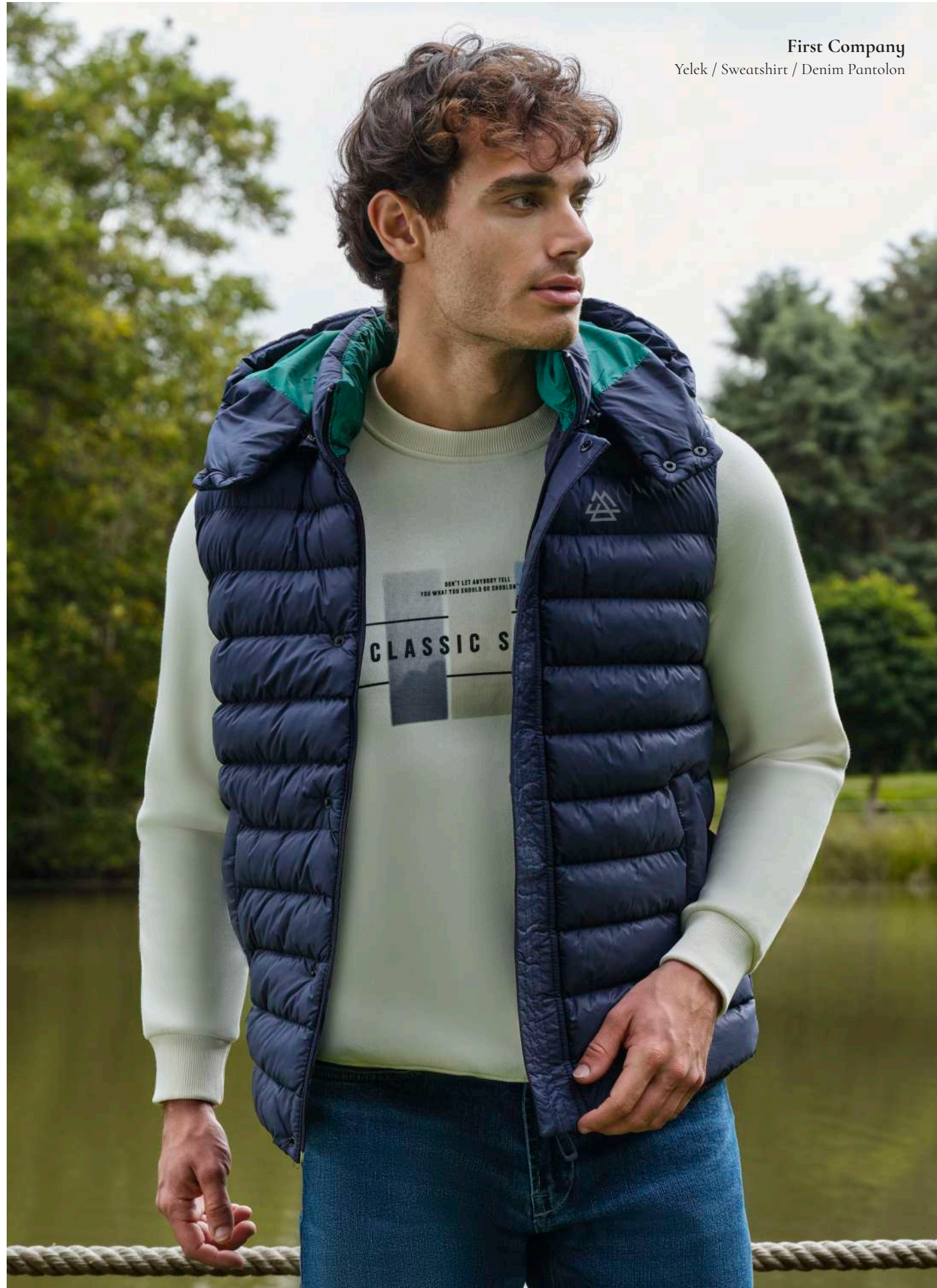
First Company Yelek / Sweatshirt / Denim Pantolon