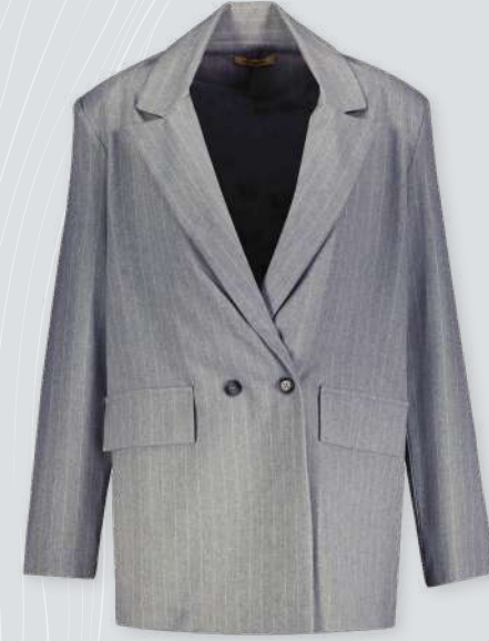
First Company Ceket