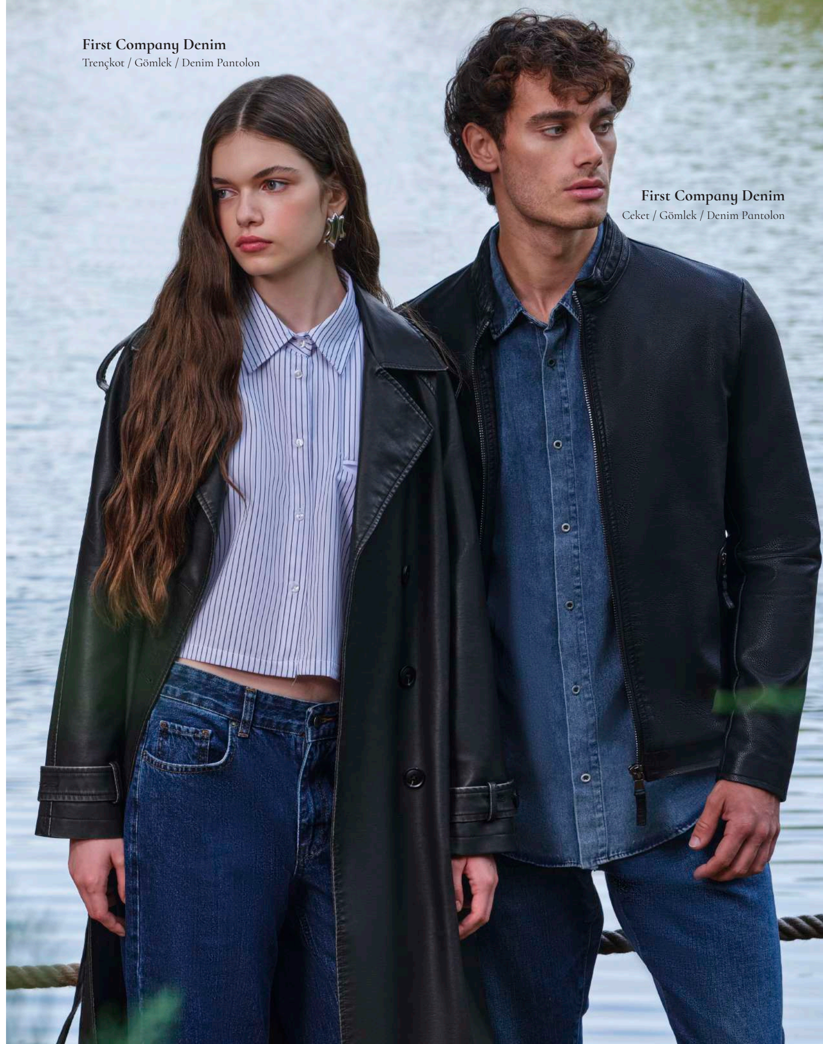
First Company Denim Ceket / Gömlek / Denim Pantolon