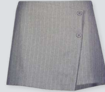
First Company Şort Etek